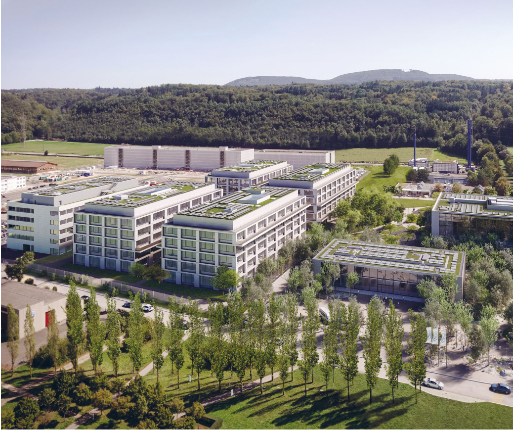
Vier Bürogebäude für Roche, Kaiseraugst