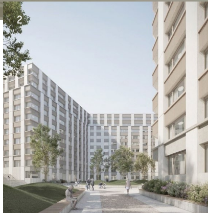
1 Studentenwohnungen ETH Zürich 2 PAD Gachoud, Fribourg