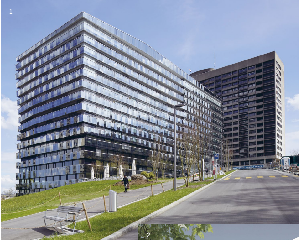
1 Bettenhaus Stadtspital Triemli, Zürich 2 St. Claraspital, Basel