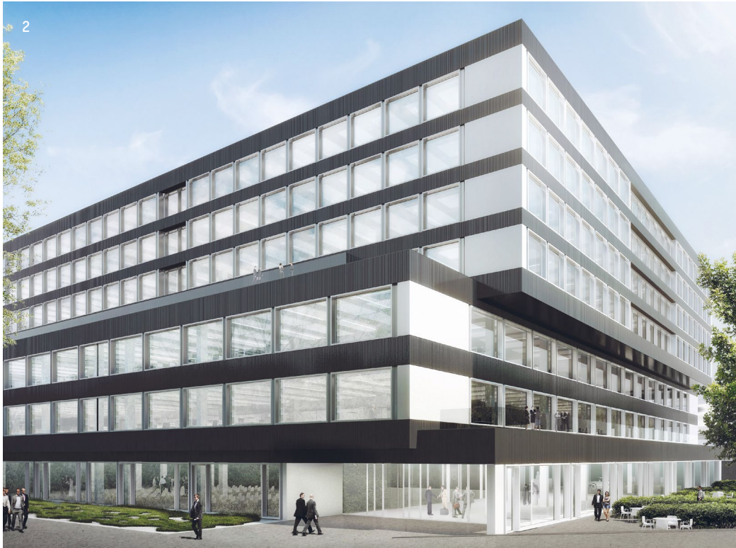
1 «Pont Rouge», Genève 2 Ambassador House, Opfikon