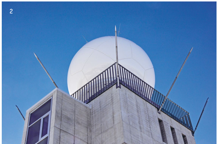
1 Tropenhaus, Frutigen 2 Wetterradarsystem Weissfluhgipfel, Davos