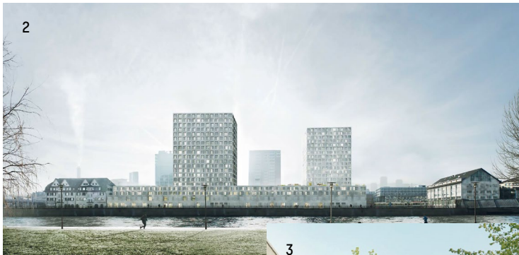
1 Viererfeld/Mittelfeld, Bern 2 Depot Hard, Zürich 3 Litterna, Visp